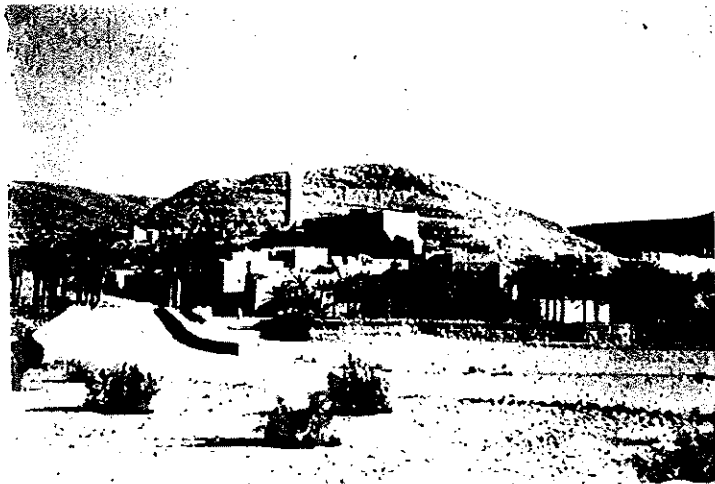
Methli des Chaamba