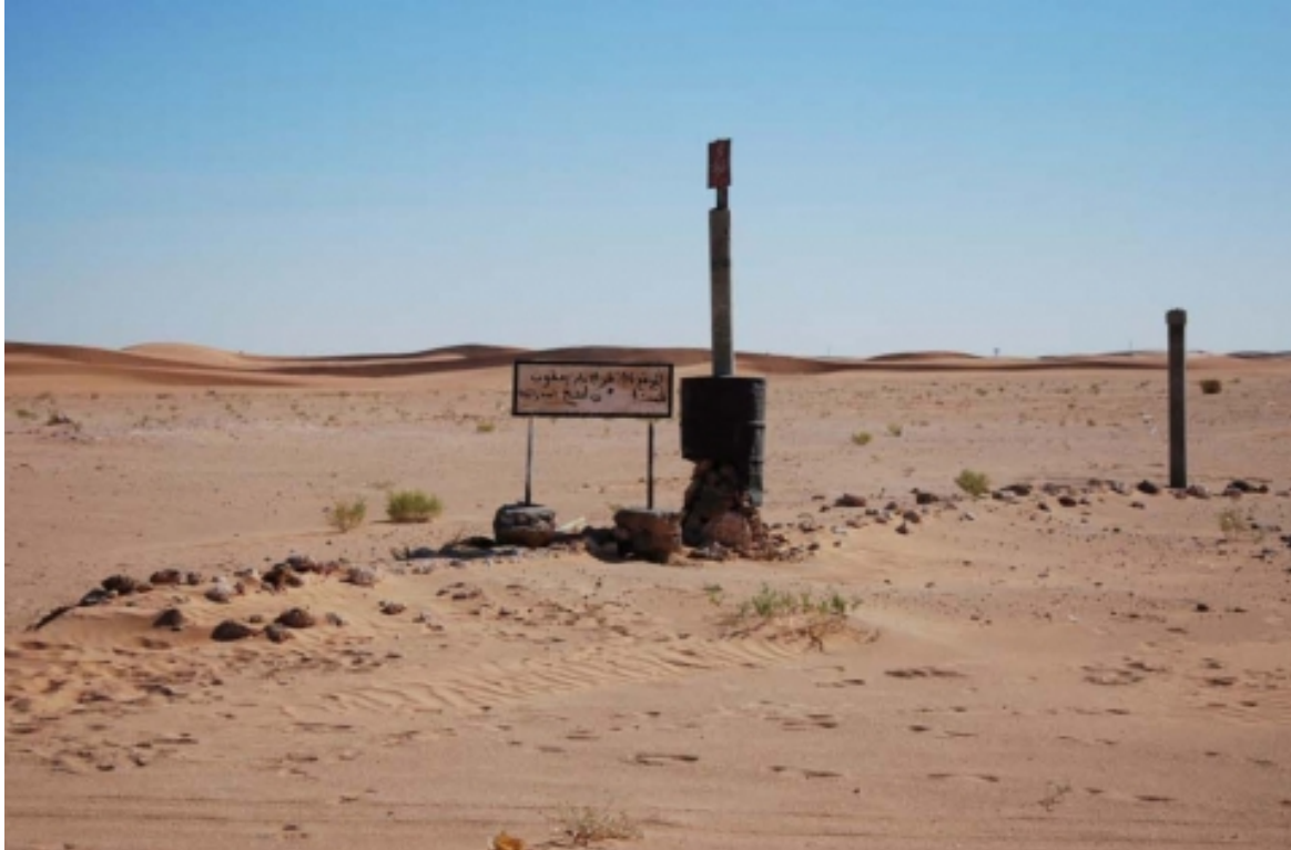
avril 2011

le rayonnement du pèlerinage héritent de cette longue tradition d'élaboration de la mémoire d'un lieu dont on ne connaît finalement encore que très peu les caractéristiques et l'histoire 1 .