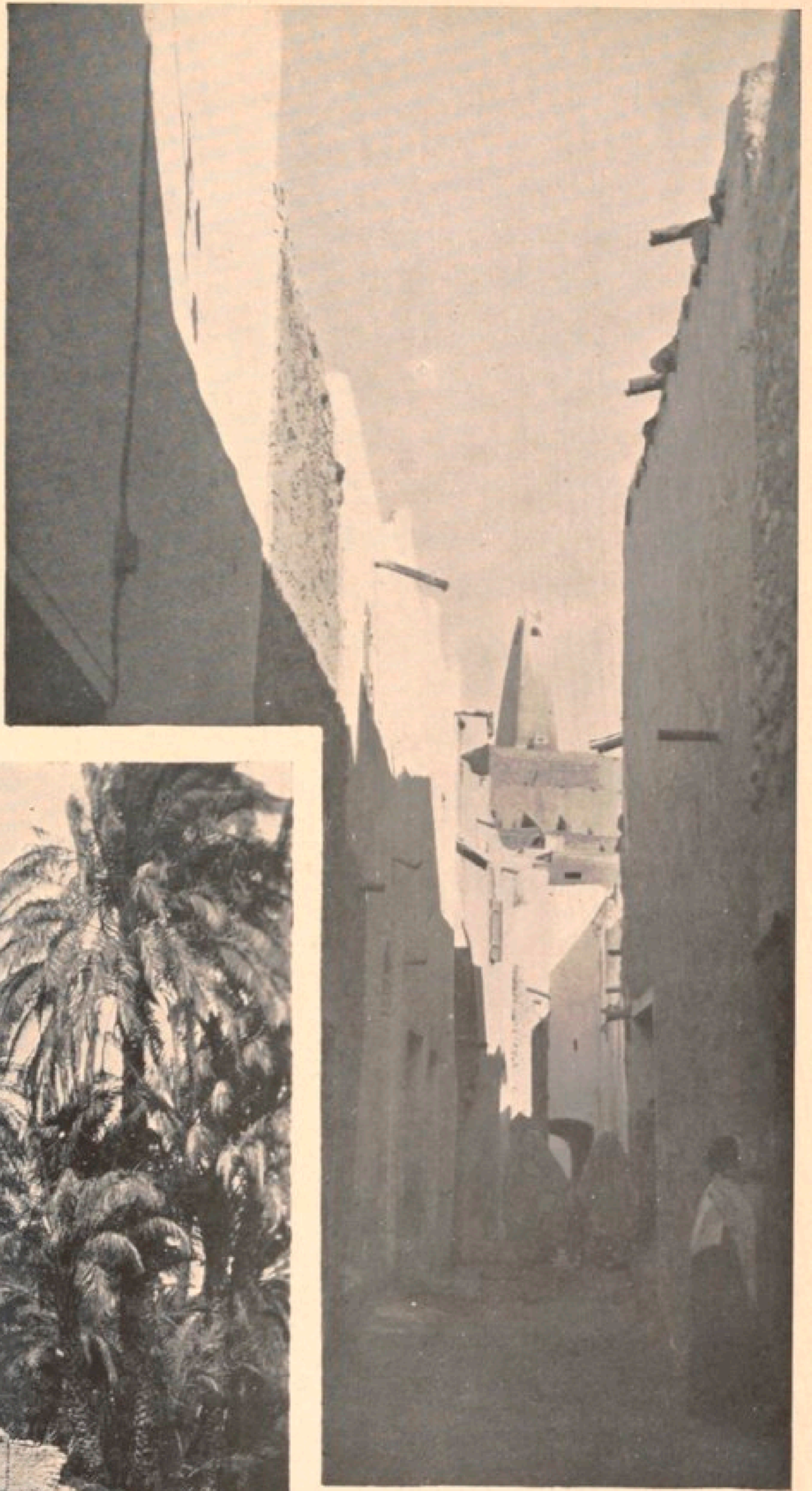
Rue de Ghardaïa