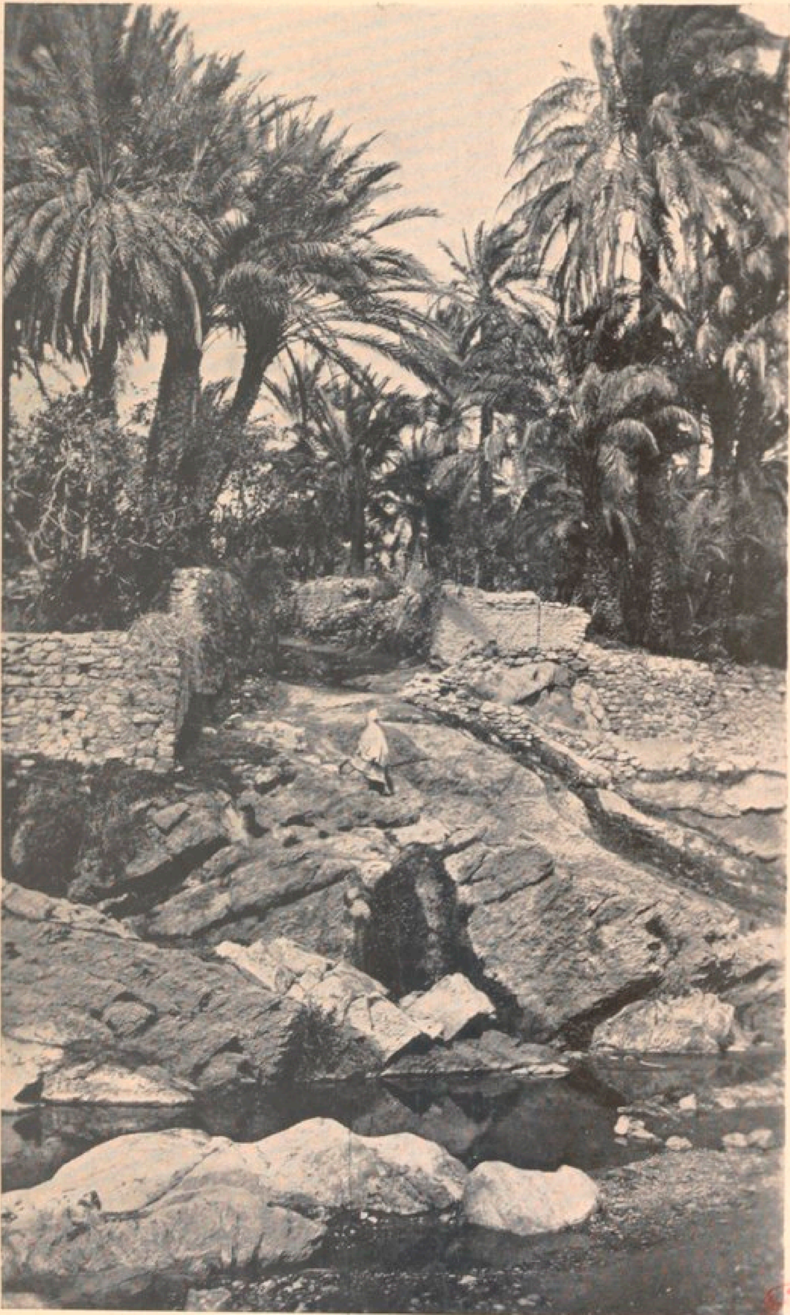
Palmeraie de Bou Saâda