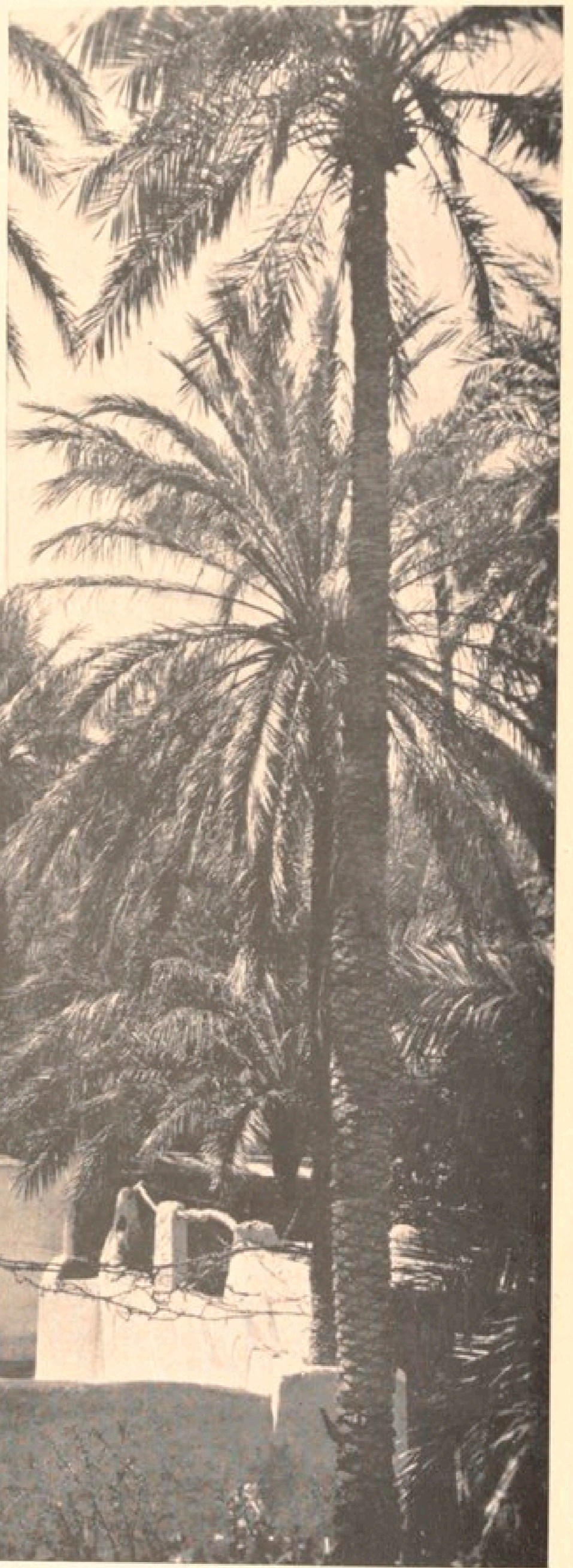
Oasis de Ghardaïa