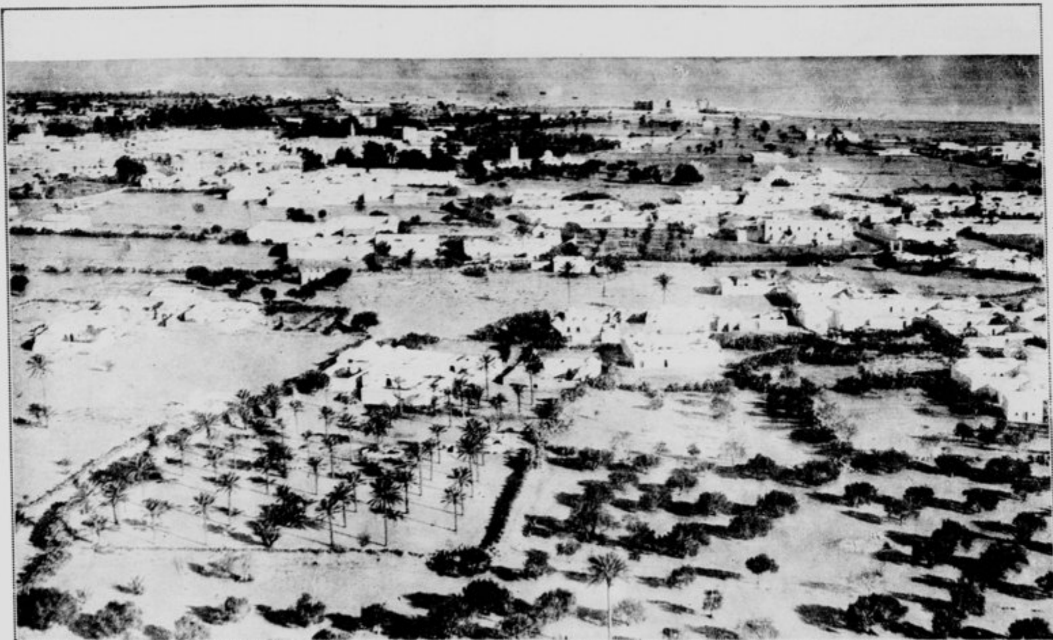
Djerba Houmt Souk, vue prise en avion.