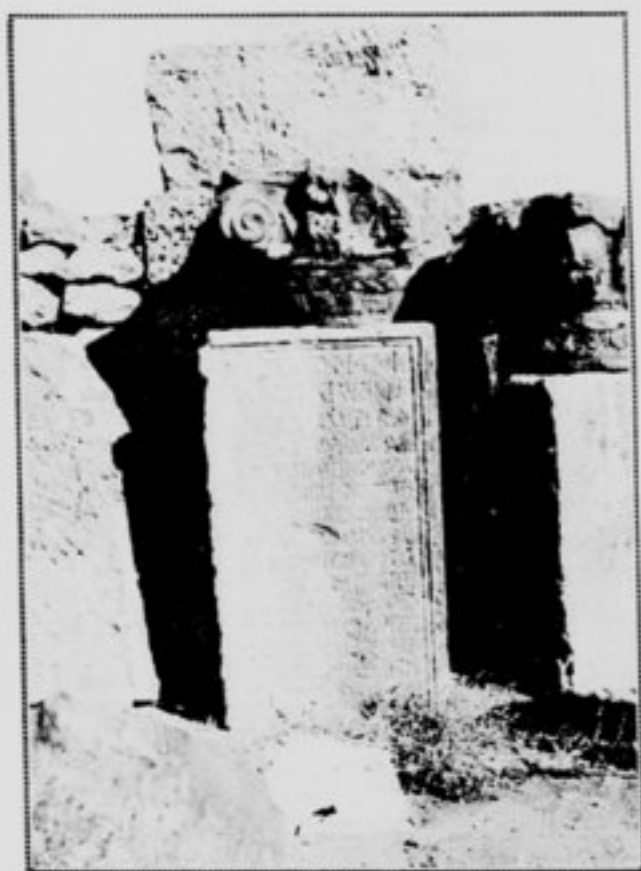
Inscriptions latines à Gyptis.

ioniennes. Son souk est sans doute l'image de leurs marchés. On y voit toujours des vieillards graves vêtus de robes trainantes, accroupis dans de minuscules échoppes où se perpétue le parfum des aromates. Les orfèvres y forgent des bijoux qui ressemblent à ceux des tombeaux, tels ces minces disques d'or dont les juives ornent leurs coiffures. Les tisserands y mêlent la laine avec la soie. Les brodeurs y couvrent de points menus de belles étoffes. Elles eussent fait la joie des élégantes de Corinthe, les couvertures rayées, les ceintures, les écharpes qui sortent de leurs mains.