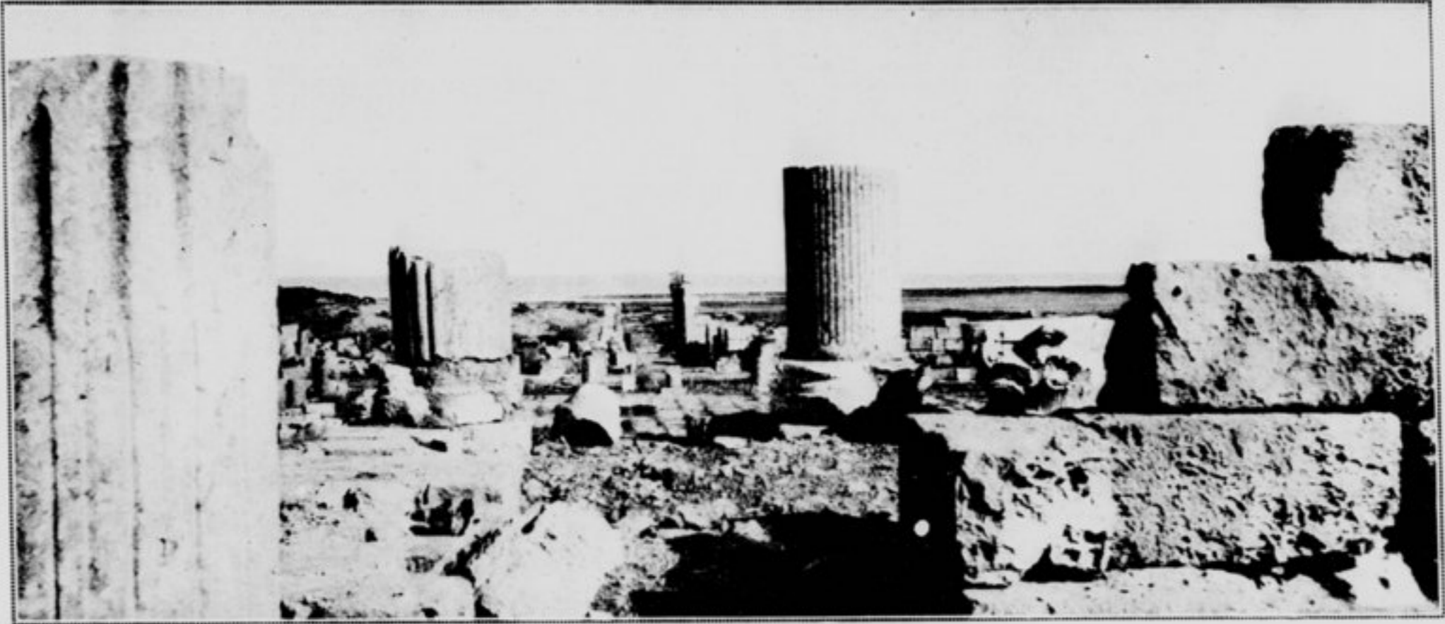
Ruines du Forum de Gyptis.