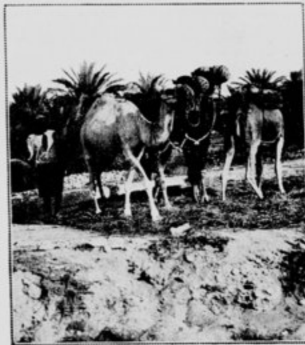
Dans les jardins de Mahabouhine.

Un warf primitif dont les pilotis servent de perchoirs aux oiseaux marins protège le petit port. Des pêcheurs d'éponges y viennent relâcher