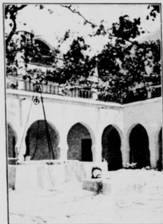
Cour de maison arabe à Djerba.

Pendant longtemps on put voir à Djerba deux importants souvenirs de son histoire. L'un d'eux, la Tour des Crânes, macabre trophée élevé avec les ossements de ses ennemis par l'amiral turc Piali Pacha après sa victoire définitive de 1560 sur les Espagnols, fut détruite en 1850 par ordre du bey Ahmed ben Mahmoud qui en fit respectueusement inhumer les matériaux humains. Désormais l'île garde un seul vestige des guerres passées. C'est une puissante forteresse construite en 1285 par Jean de Loria à l'est du port d'Houmt-Souk.