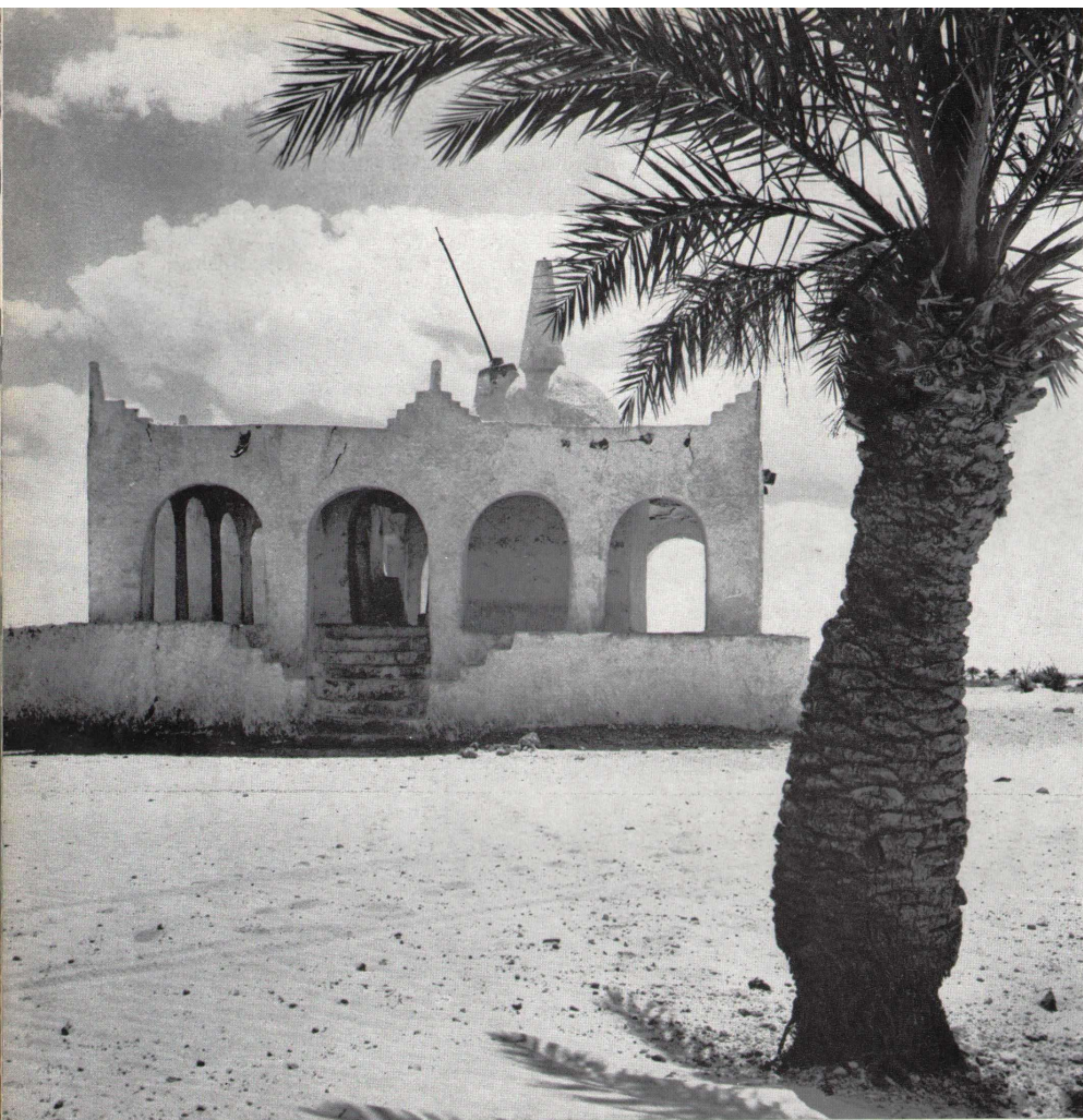
Kouba de Si Abd-el-Kader.

ORGANISATION DU COMMANDEMENT. La ville de Ouargla et sa région furent constituées en annexe, laquelle était commandée par un officier, dépendant du Gouvernement général de l'Algérie. Le chef d'annexe avait sous ses ordres des caïds qui commandaient chacun une tribu, lesquels étaient secondés par des chefs de fraction. Cette organisation demeura en place jusqu'en 1958, date à laquelle les institutions nouvelles entrèrent en vigueur : création de conseils municipaux, réformes communales.