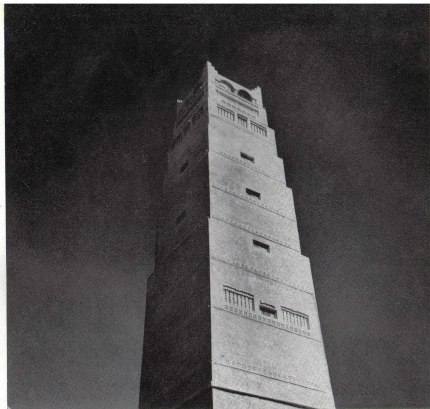
Le minaret de la Mosquée.