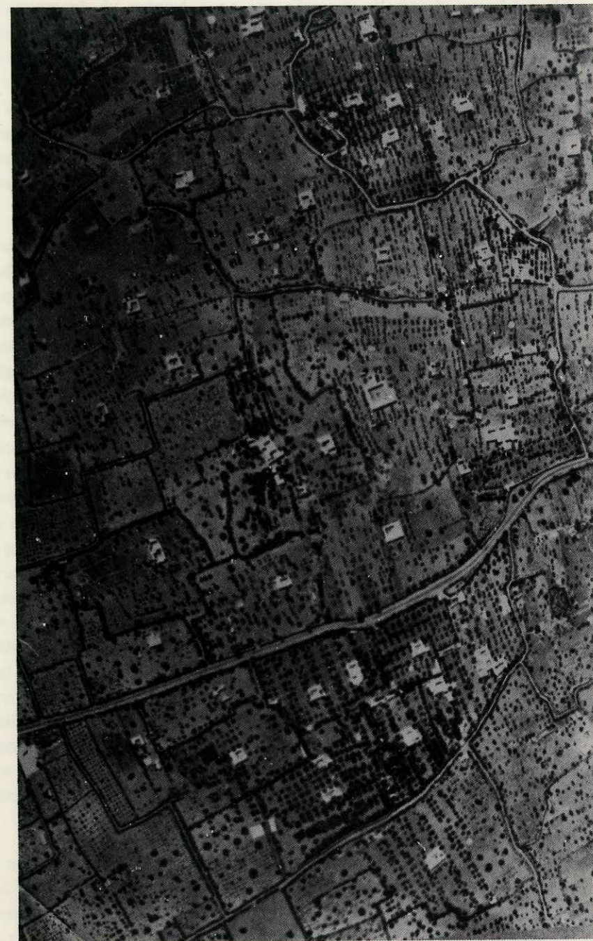
— Vue aérienne de la région de Midoun montrant la dispersion de l'habitat et le morcellement foncier. Les menzels, dont la forme carrée autour d'une cour centrale est apparente, ne sont jamais disposés en bordure des chemins.

Sans elle on ne pourrait comprendre ni le morcellement foncier qui a pulvérisé la propriété au fur et à mesure de la progression démographique, ni la conception autarcique de l'économie, chaque