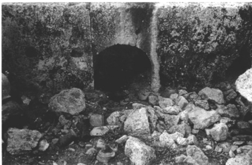
Fig. 16 : Niche dont le tracé de la forme est complété par un second bloc justapposé (située à l'Est dans la paroi Sud)