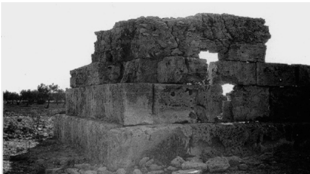
Fig. 9 : Détail angulaire des assises