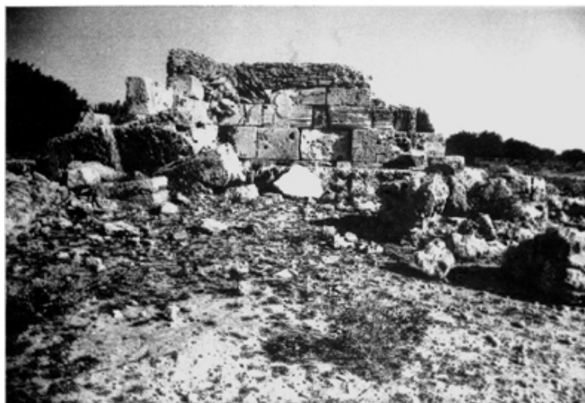
Fig. 11 : Détérioration des façades