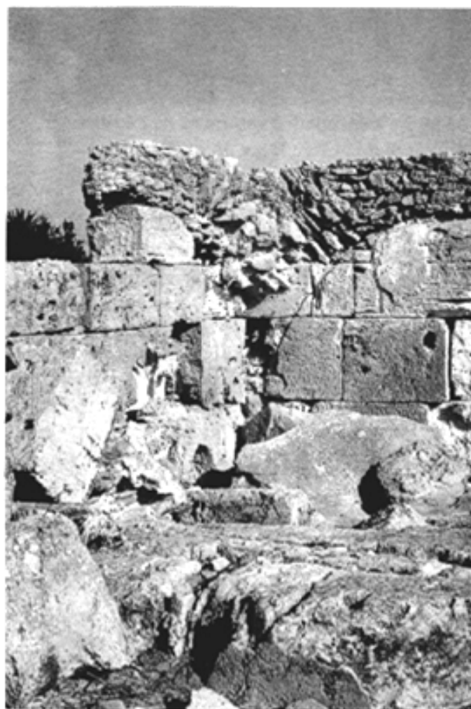
Fig. 10 : Détail de la toiture - vue intérieure