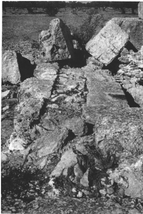
Fig. 7 : Dégradation des murs de l'édifice (détail de la technique de construction)