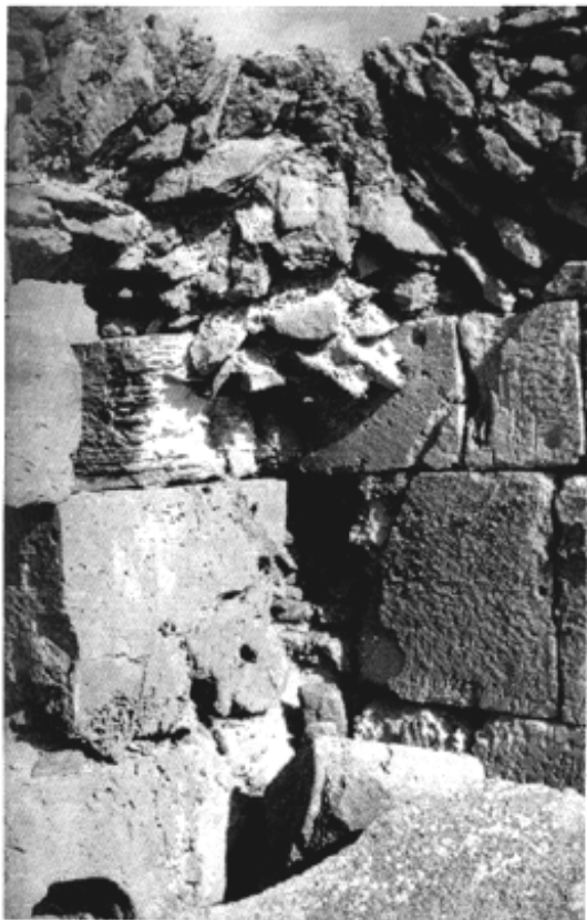
Fig. 13 : Vue de l'intérieur alignement des assises