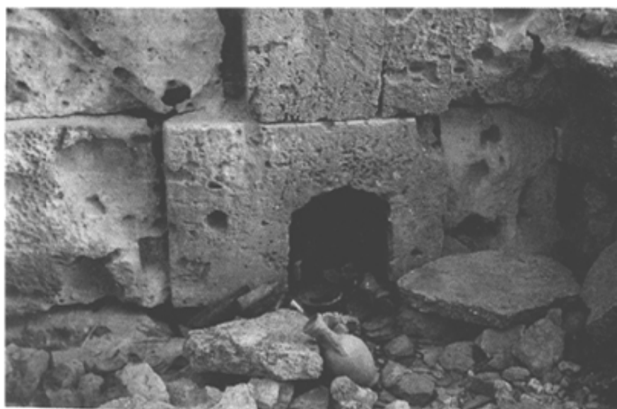
Fig. 15 : Niche taillée dans un même bloc dans la paroi Nord. Elle est face à face aux celle de la fig. 16.