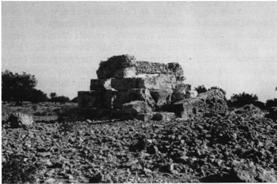
Fig. 1 : Site : vue d'ensemble