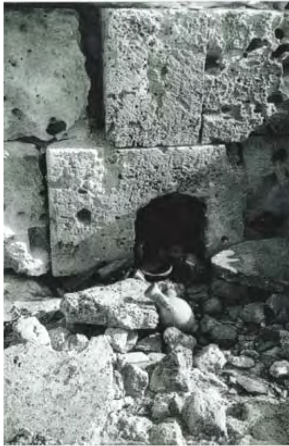
Fig. 3 : Vue d'une niche, objet d'un culte rural (dépôt d'offrandes)