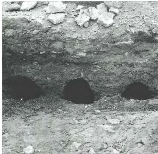
Fig. 18 : Columbarium de Henchir El Kantara - Meninx (inédit)