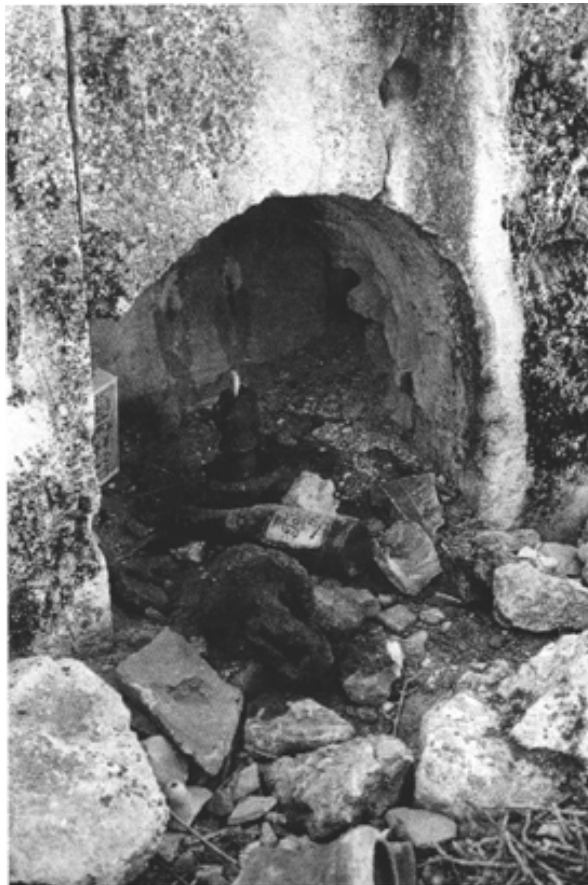
Fig. 2 : Niche avec dépôt d'offrandes