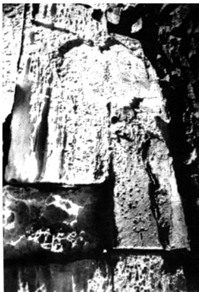
Fig. 17 : Vue de l'intérieur : détail de l'enduit