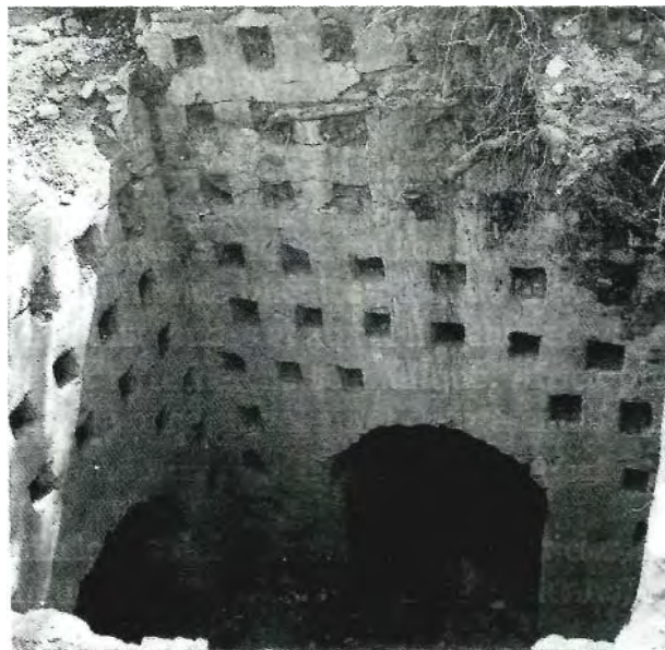
Fig. 19 : Environs de Bannane : columbarium romain (inédit)