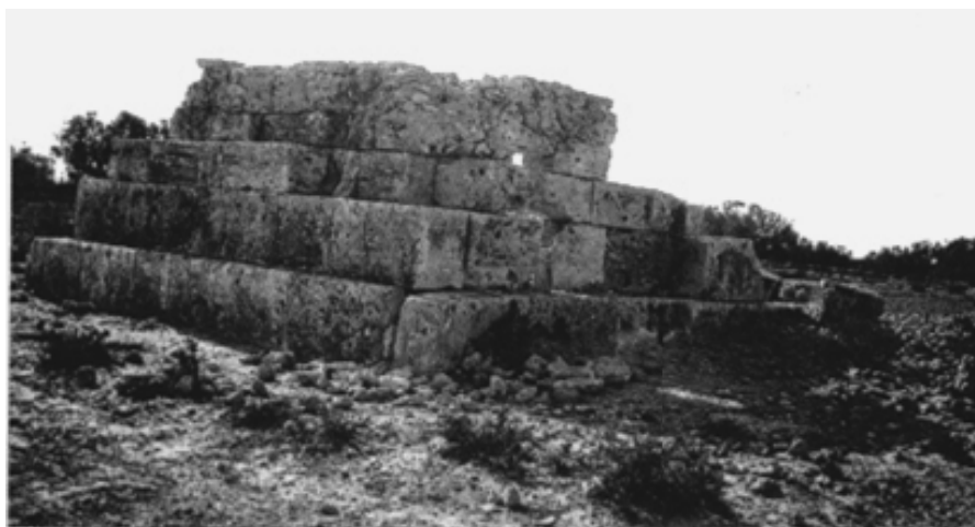
Fig. 4 : Vue du columbarium détail de l'extérieur Nord Ouest