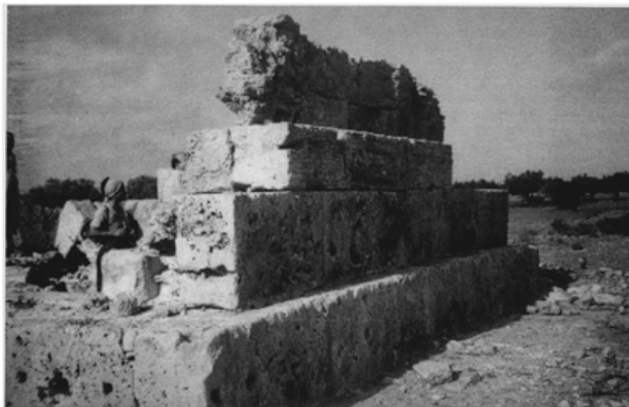
Fig. 6 : Vue de l'extérieur (détail)