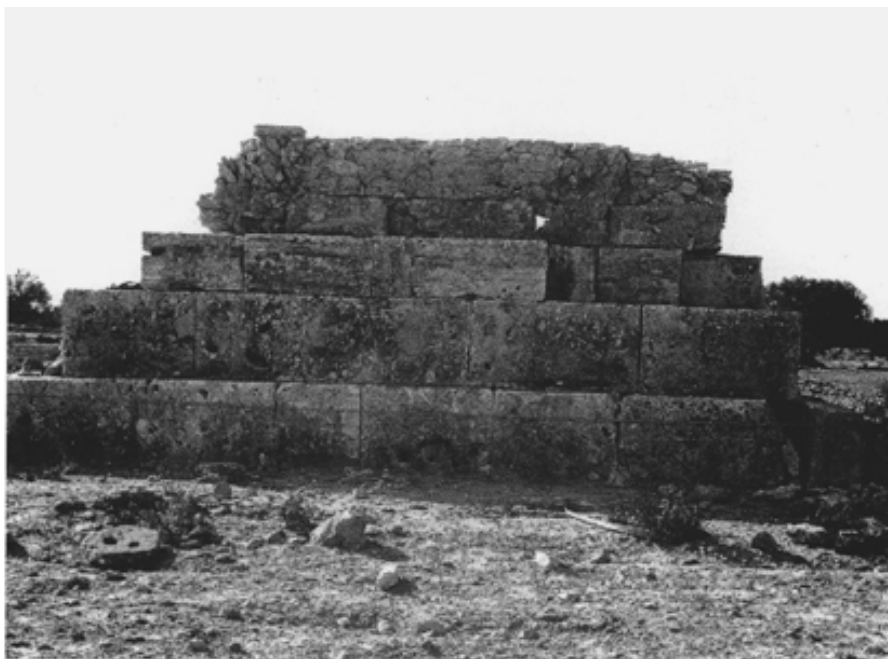
Fig. 5 : Détail de l'extérieur