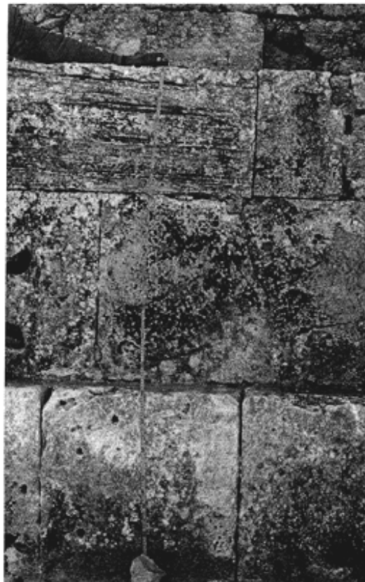
Fig. 14 : Détail : grandeur variée des blocs