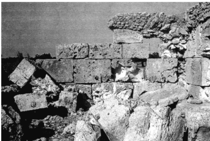
Fig. 12 : Détail des techniques de construction