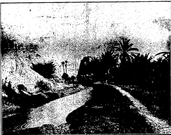
RAS EL OUED