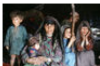
Réfugiés Afghans Iran