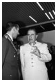
Pinochet et Videla

Derrière leurs fortes jumelles et leurs radars, les gardiens de l'île des Chèvres, en bordure du détroit d'Ormouz, n'ont jamais été plus vigilants. Bien qu'ils se trouvent à 900 km du Koweït et du débouché irakien dans le fond du golfe Persique, ils voient passer du monde et ne dorment pas tranquilles.