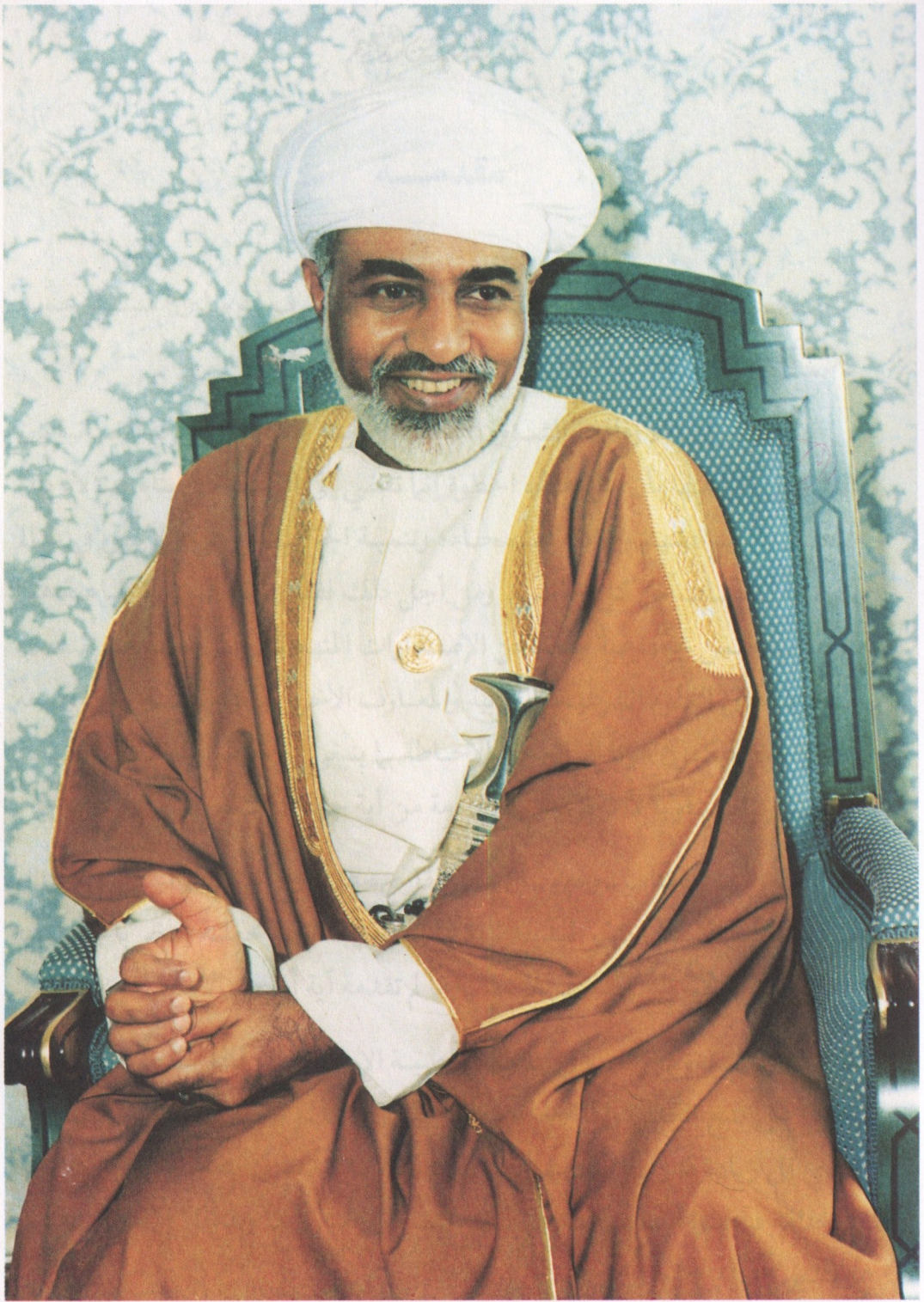
جفیر صاحبزادہ سلطان قابو بن سعید المعظم